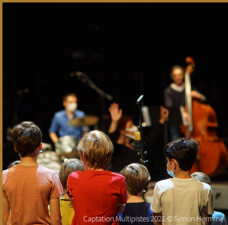
Captation Multipistes 2021

Multipistes est né d'une initiative commune entre le Conservatoire à Rayonnement Départemental de Laval Agglo et le 6PAR4, scène de musiques actuelles de Laval.