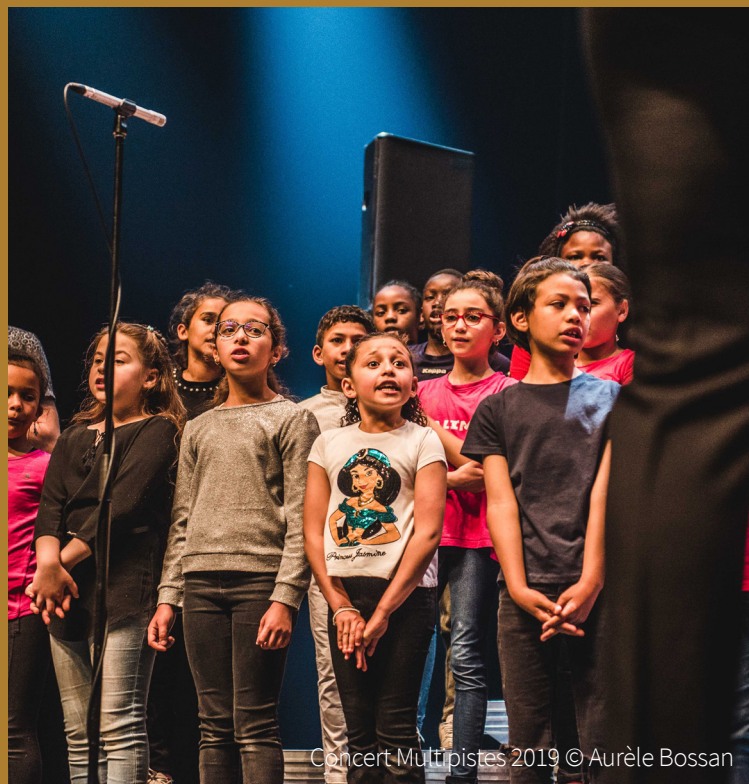
Concert Multipistes 2019