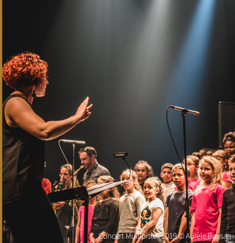
Concert Multipistes 2019