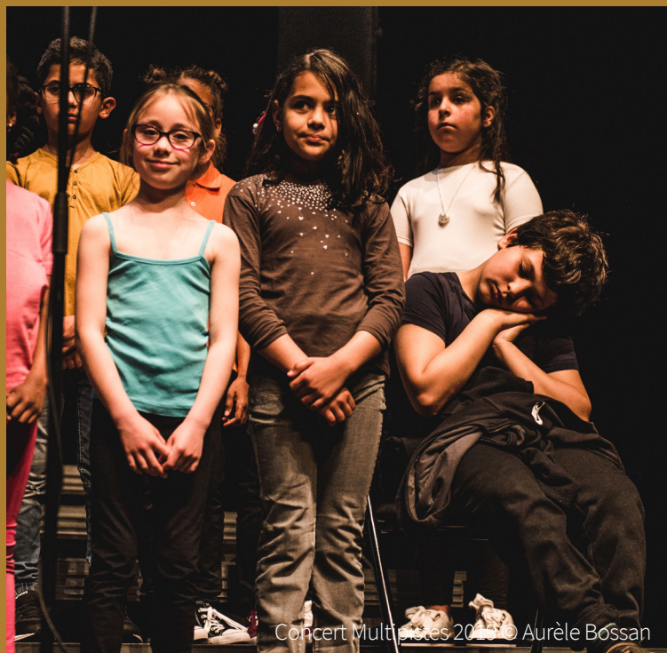
Concert Multipistes 2019